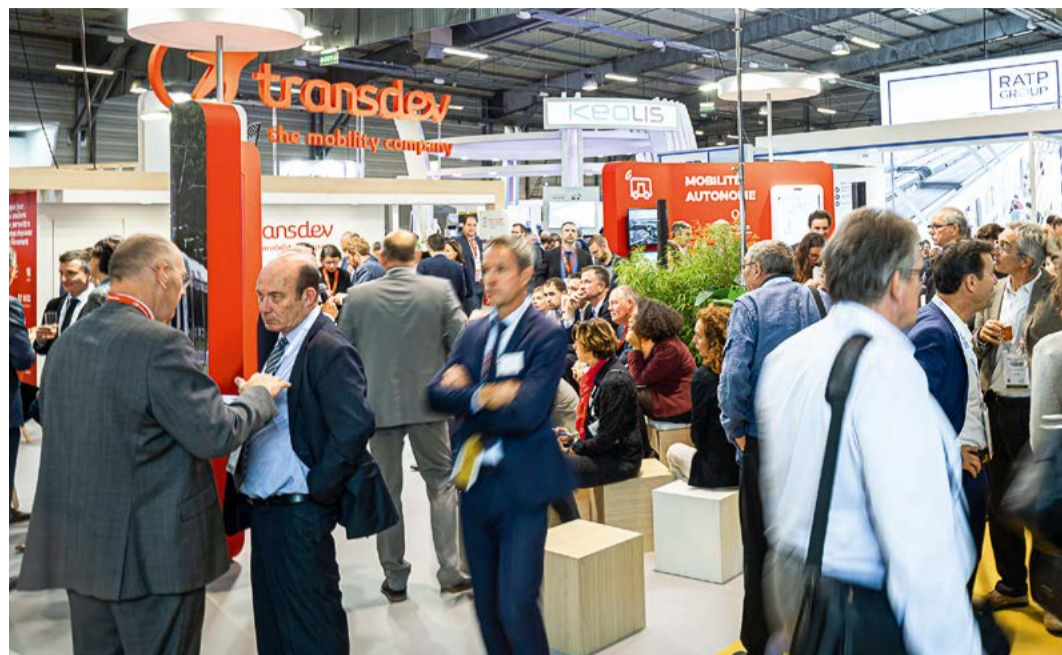
Moment de convivialité lors des Rencontres 2019 à Nantes.