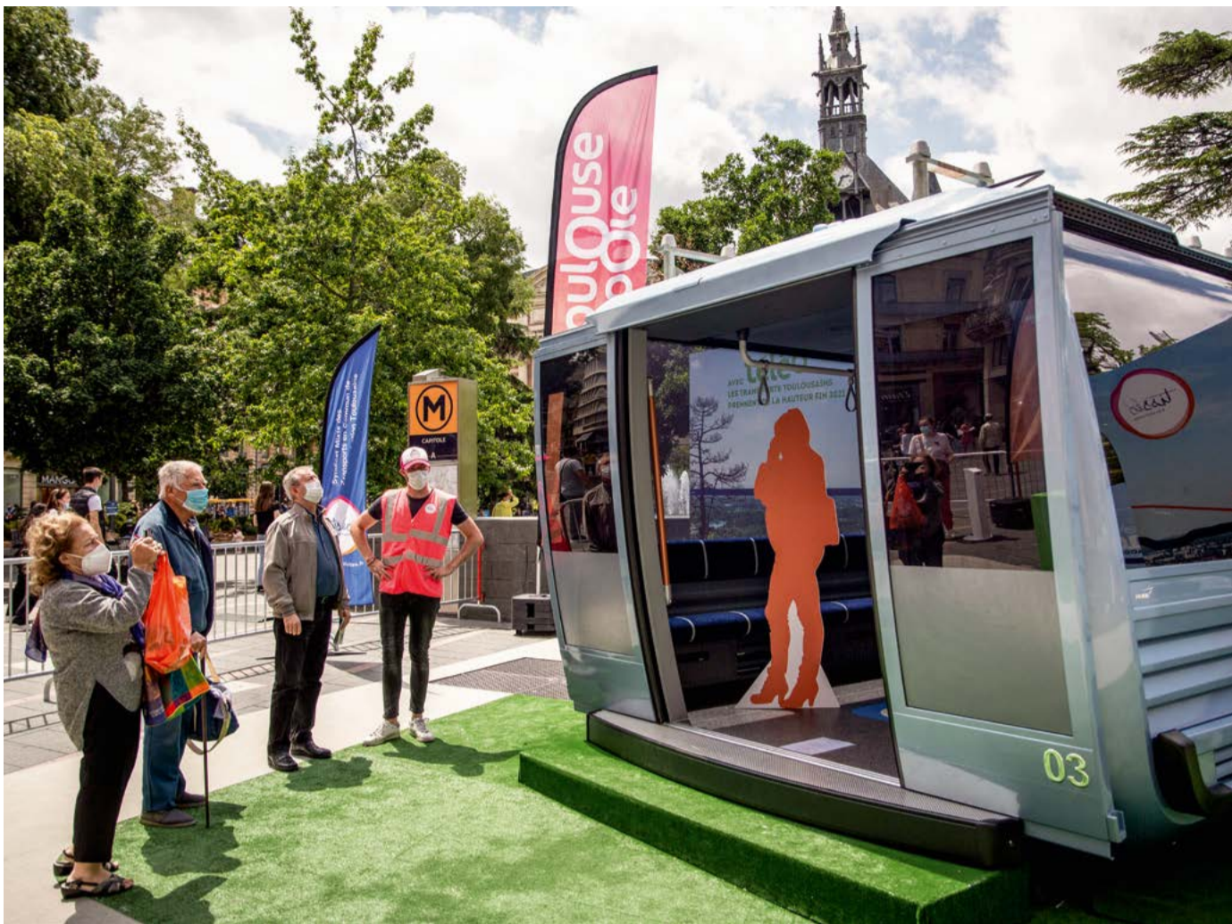
Exposition de la cabine du nouveau téléphérique Teleo sur la place du Capitole.